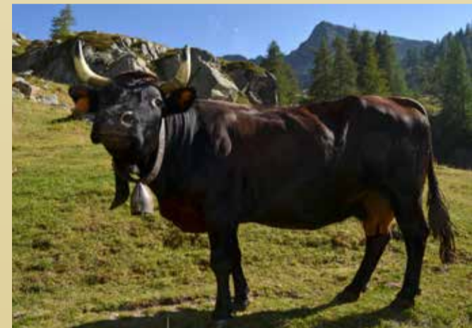
REINE DES CORNES Vespa de Roggero Vallomy (Lillianes)