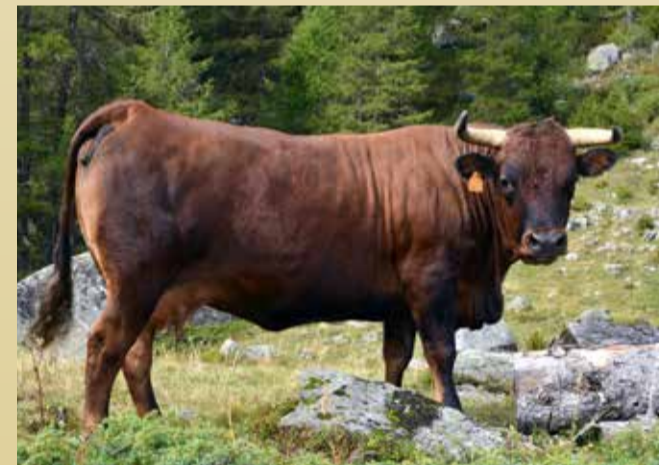
REINE DES CORNES Contine de Paolo Dalbard (Pollein)