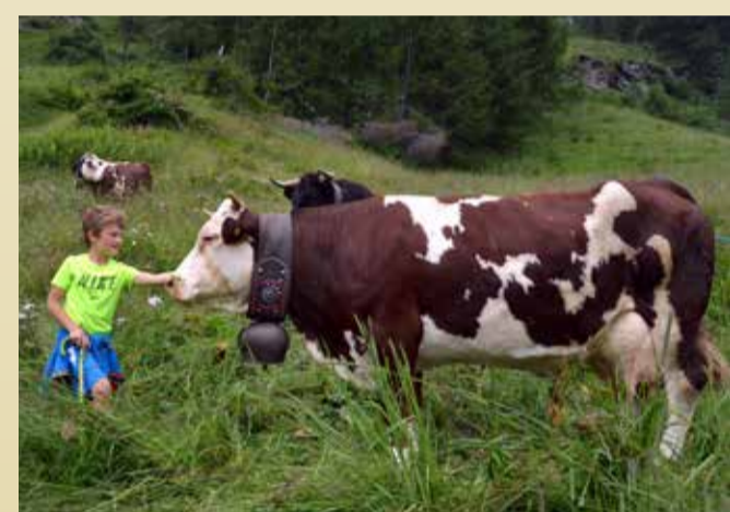
REINE DU LAIT Fregaille de Marcellan&Verthuy (Antey-Saint-André)