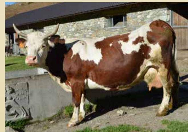
REINE DU LAIT Zerbina d'Ivana Glassier (Roisan)