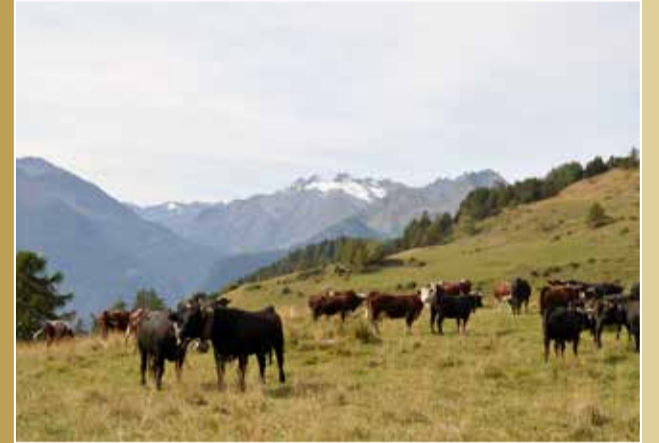
LA CHÂTELAINE | Saint-Pierre