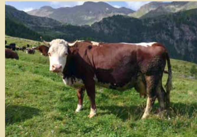
REINE DU LAIT | Asiago de Carlo Porliod (Aoste)