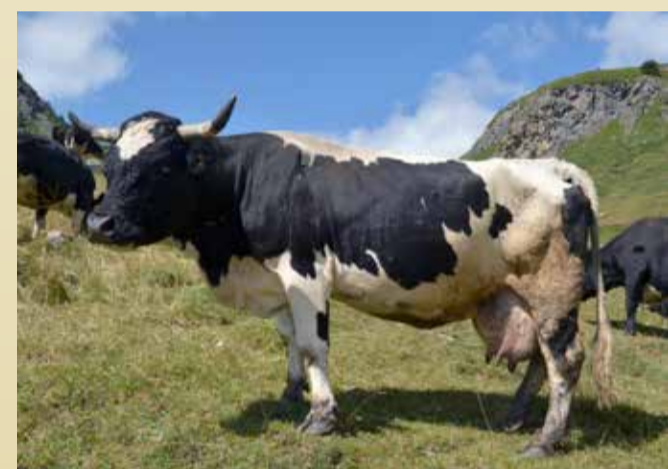
REINE DU LAIT Gitane de Camillo Brédy (Oyace)