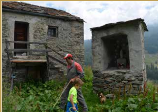
LE CRÉTON | Valtournenche