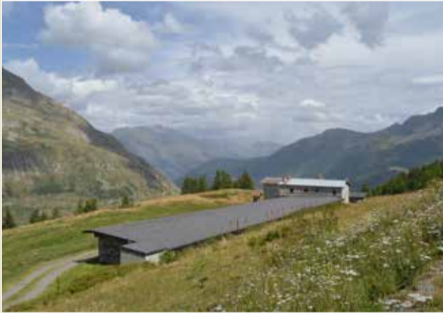
LA TOUR | La Thuile