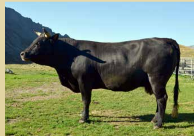
REINE DES CORNES Piston de Jean-Pierre Albaney (Charvensod)