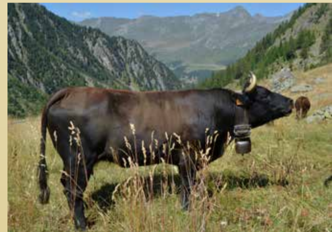
REINE DES CORNES Bizarre d'Aurelio Vercellin-Nourissat (Fontainemore)