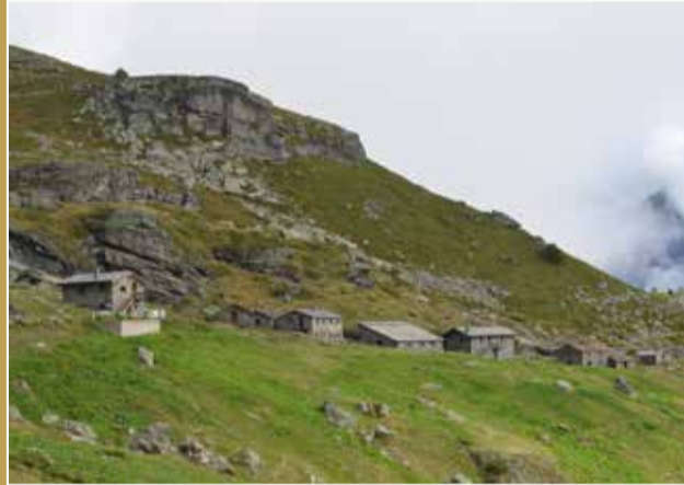
L'ARP VIEILLE | Valgrisenche