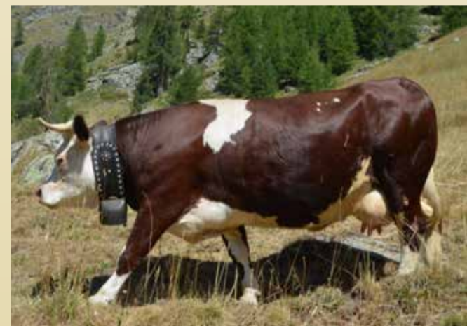
REINE DU LAIT Farca d'Aurelio Vercellin-Nourissat (Fontainemore)