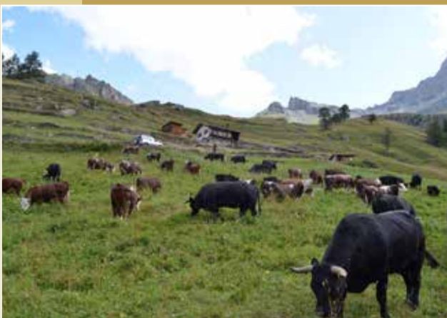
CUNÉAZ | Ayas