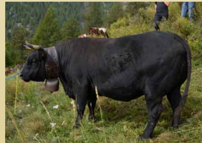
REINE DES CORNES | Trésor d'Alfredo Girod (Fontainemore)