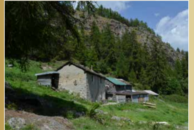
FONTILLON | Saint-Marcel