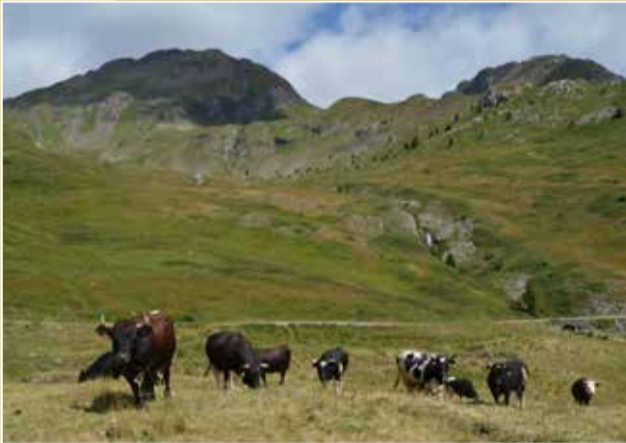
FRUMIÈRE | Sarre