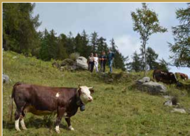
CHAMPAS | Fontainemore