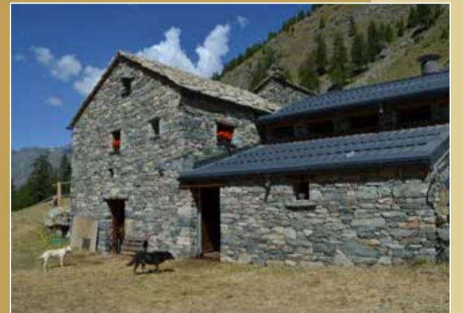
GEMME | Ayas