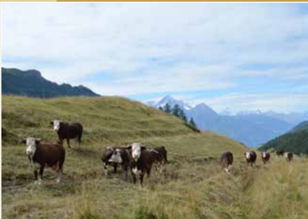
LE PLAN CROU | Nus