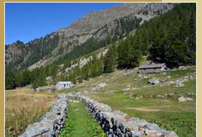
ONDREBODMAA | Gressoney-Saint-Jean