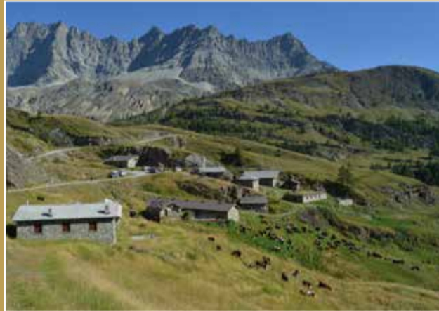
LA BALME | Ollomont