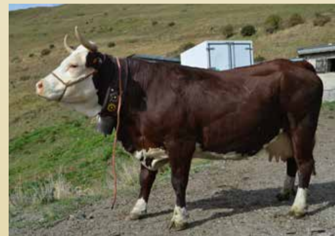
REINE DU LAIT Imperia de Corrado Diémoz (Doues)