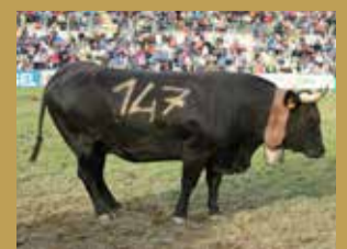
Reine régionale 3 ème cat. FARCHETTA Rosset Lorenzo - Nus