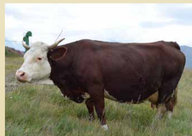
REINE DU LAIT Palina de Nelly et Ivo Empereur (Gressan)