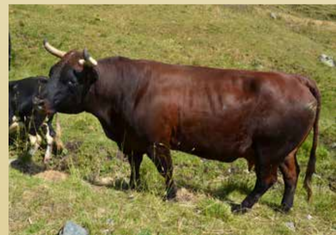
REINE DES CORNES Suisse d'Edi Henriët (Gignod)