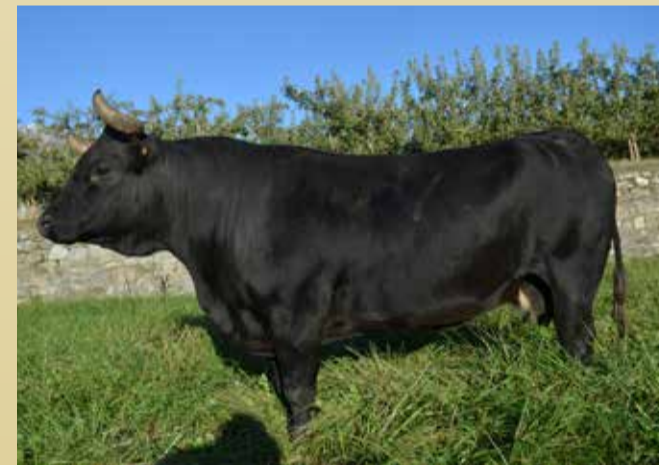
REINE DES CORNES Borga de Vincent Quendoz (Jovençan)